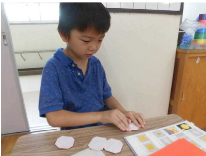
秋といえばお月見！ お月見の掛け軸を作りました。