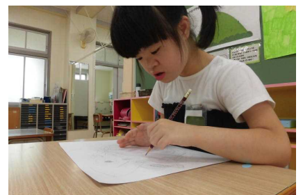
顔の絵を描きました。