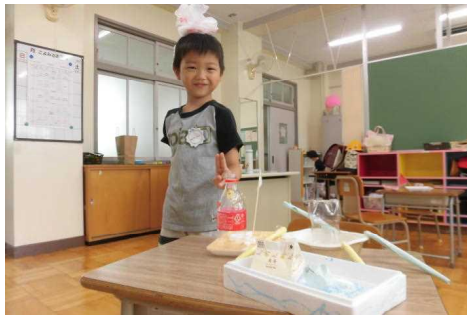
生活の授業で船を作りました。