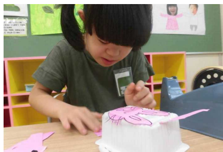
図工の授業で「おさんぼ ころころ」 を作りました。