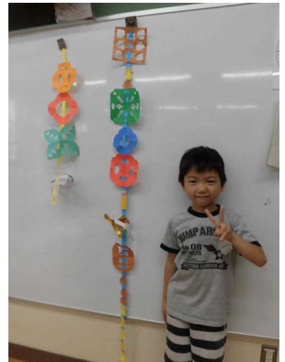
図工の授業で 「ちょきちょき かざり」 を作りました。