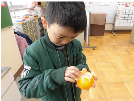
初めてみかんの皮をむきました！