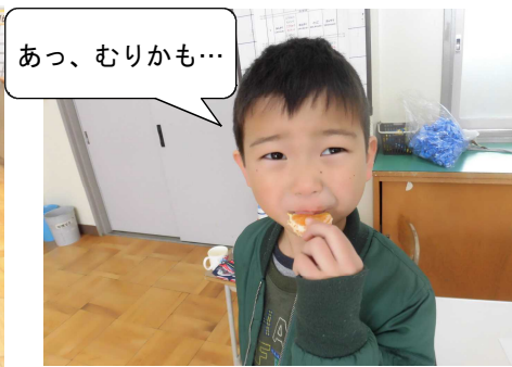
一口食べてみると…