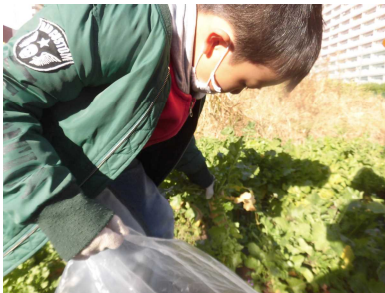
カー杯ひっぱって…