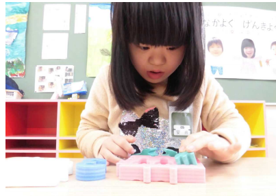
穴にピースをはめ込んで…