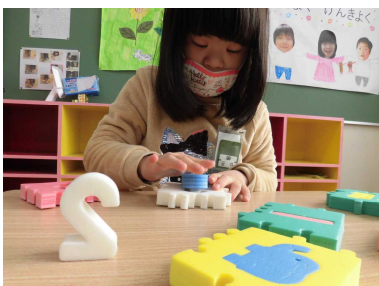
穴の形に合うピースを選んで…