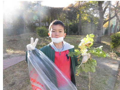
大きな大根が出てきました！