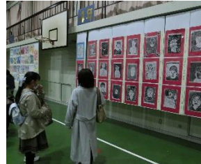
【作品を鑑賞する様子】

すみれ1組「生活のめあてを決めよう」の学習では、自分の生活を振り返り、できたことやできなかったことを考えました。子どもたちは、「掃除を頑張った」「先生に挨拶をしっかりと」と、できたことを発表した後、できなかったことやその理由を考え、「ハンカチを身に付ける」「友達にも挨拶をする」と新たなめあてを決めることができました。しっかりと自分の生活を振り返ることができたと思います。