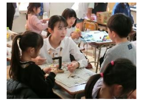
【おもちゃづくりの様子】

4年体育科「体づくりと高とび」の授業の様子です。この授業では、「助走・跳ぶ姿勢・着地」の中から、自分の課題を見つけて練習をしました。子どもたちは、タブレットPCを活用して跳ぶ姿を撮影し、動画を見て振り返ることで、より高くより美しく跳ぶためのさらなる課題を見付け、次回への意欲を高めることができました。