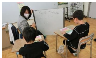
【生活を振り返る様子】

1年生生活科「あきとなかよし」の学習では、自分でめあてを決めて、秋の自然物を使ったおもちゃづくりに取り組みました。子どもたちは、「もっと難しい迷路を作りたい」「この部分を作り直したい」と各自で決めためあてを意識して、友達と助け合ったり、何度も試行錯誤したりしながら、真剣に活動することができました。