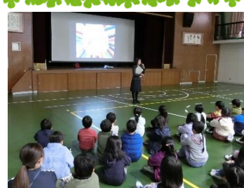
【校長先生の人権講話】

先日は、作品展を参観していただき、ありがとうございました。色とりどりの作品が体育館を飾り、素敵な作品展になりました。子どもたちが気持ちを込めて丁寧に作り上げた作品をご覧いただくことができたと思います。子どもたちには、最後まで粘り強く取り組む気持ちを今後も大切にしてほしいです。