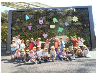
みんなで「はい！チーズ」☆

みんなお兄さん・お姉さんらしい態度で行動する姿に成長を感じました。楽しい思い出ができました。