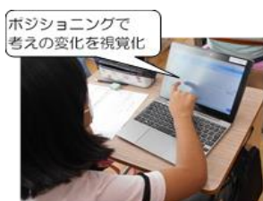
【考えを視覚化している様子】

今年度は、「考えを深め、物事を多角的・多面的に捉える」力を高めたいと考え、サブテーマを「違いに着目して話し合おう」として努力点に取り組みました。5月と12月のアンケートの結果からは、意見交流を通して、考えの違いを見つけたり、違いに着目して話し合ったりする力が伸びたことが分かります。違いに着目したことで、一人一人が課題を捉え、追求する力も伸びてきました。しかし、授業の中では意欲的に取り組むことができて、自ら「学びたい」という思いをもつまでには至っていない現状があります。今後は、学ぶ楽しさを子どもたちが感じられる手立てを考えていきます。