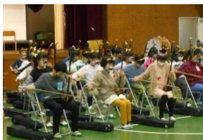
【学習発表会の様子】