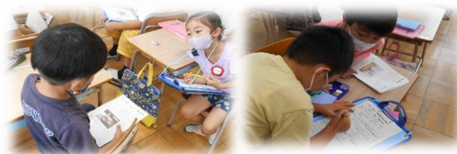
【1年生の授業の様子】

3年生では栄養教諭の努力点授業がありました。給食で友達の嫌いな食べ物を食べてあげることは、本当の優しさなのかを考えました。意見によって色分けされたプレート为首から掲げることで、一人ひとりの意見が一目で分かるよう工夫されていました。自分とは異なる意見の友達の話を聞いたり、同じ考えの子同士で理由を話し合ったりした後は、改めて自分の意見をまとめていました。様々な意見に触れることで、相手や状況に応じた「優しさ」があることに気付くことができました。