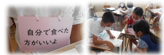
【栄養教諭の授業の様子】