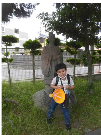
お気に入りの 人形とパシャッ！