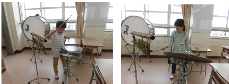
「おもちゃのチャチャチャ」に合わせて演奏しました！