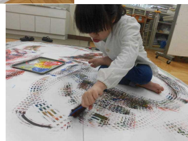
ローラーをコロコロして、できあがった柄を楽しみました！