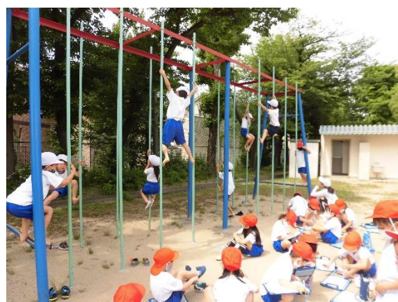
手にまめができるまで頑張ったよ！