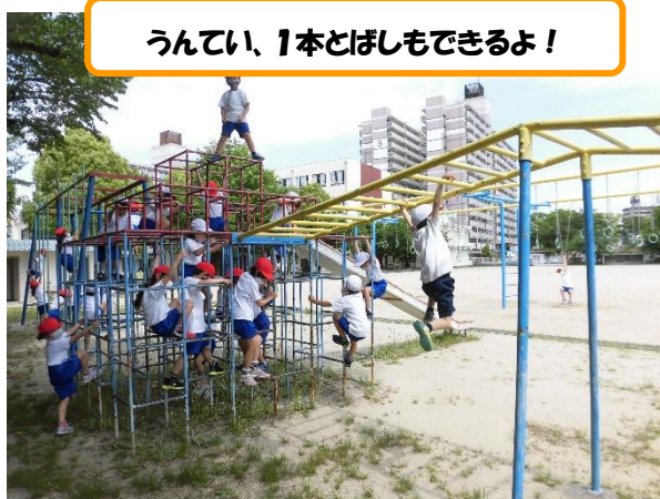
うんてい、1本とぼしもできるよ！