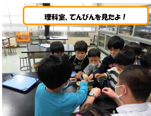
理科室、てんびんを見たよ！