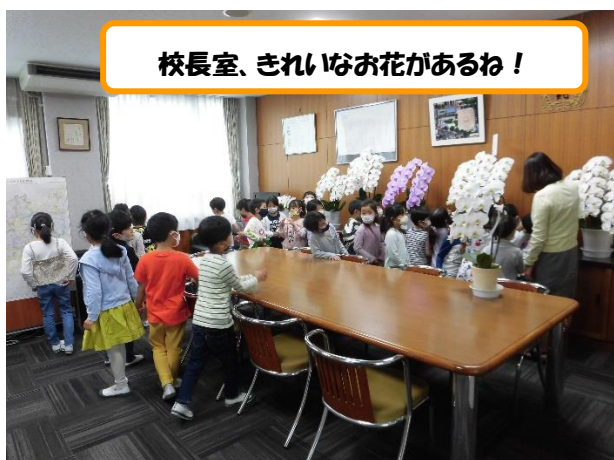
校長室、きれいなお花があるね！