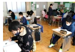
【様々な学習形態で学ぶ様子】

愛知小では「学び合う あいちっ子」を主題とし、「一人一人の学習進度や到達度に合わせた活動」と「学びを深めるための対話を取り入れた活動」を両輪として授業を行ってきました。一人一人に合わせた活動として、6年では単元のまとめの時間には、「先生と」「友達と」「一人で」の中から自分に合った学習形態を選択し、学習を進めました。「自分で選択する」ことで学びへの意識が高まり、復習に取り組む児童、発展問題に取り組む児童など、一人一人が主体的に学ぶ様子が見られました。