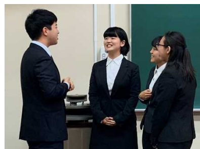
【第2回連絡サポート講座の様子】

A 名古屋市教育センターにおいて年3回実施する「連絡・サポート講座」では、学生同士で派遣校（園）での活動について情報交換をしたり、様々な教育課題への対応について学んだりすることができます。「連絡・サポート講座」は、1回の活動回数に含めます。