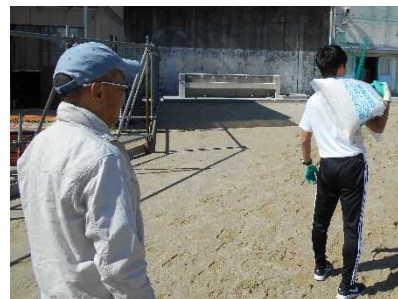
【学校整備の手伝いをしている様子】

なお、泊を伴う学校（園）行事や交通費が必要な校（園）外学習への参加、土日祝日の部活動への参加など実施時間外の活動は、対象外となります。