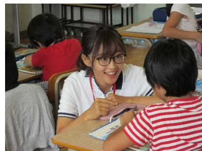
【教科指導の補助をしている様子】

派遣校（園）は、希望区、希望校種を参考に決定しますが、希望区、希望校種が集中した場合には、希望に添えない場合もあります。